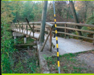
Versoix Passerelle haubané 581

Malheureusement placé sous l'autoroute ce magnifique ouvrage insolite.