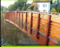
Versoix Village 582

Leider befindet sich dieser Übergang unter der Autobahn. Ein einmaliges schönes Tragwerk.