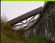
Genève Chancy 562

Angenehme zeitgenössische Brücke, leider über einem Bach, welchen man lieber nicht anschaut, verschweige recht.