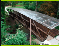
Genève Grand-Lancy De la Colline 564

Unbeachtet überquert man mit dieser Brücke die Versoix. Weiter Bachaufwärts wurde in grosses Gebiet naturalisiert. Schön zum spazieren und erholen.